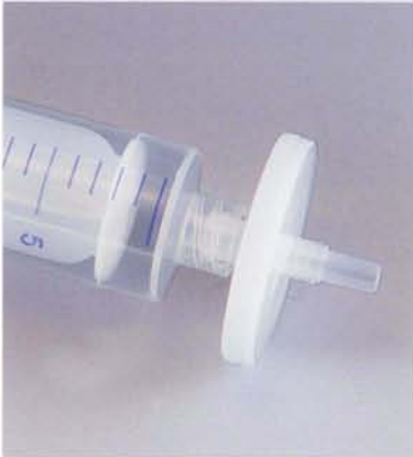
ルアーロック型 シリンジフィルター装着時

ドイツ ヘンケ社のオールプラスチック ディスポシリンジです。バレル（外筒）はポリプロピレン製、プランジャー（ピストン部）はポリエチレン製です。従来のプランジャーの先端にゴムチップを差し込んだ、はめ込み型ではなく、オールポリエチレンの一体成型プランジャーになっていますのでチップとプランジャーの脱離の危険性はありません。また、バレルの最上部にプランジャー飛び出し防止の特殊リングを施しています。どんなにバックプレッシャーがかかってもプランジャーがバレルから飛び出す心配はありません。このシリンジのプランジャーのシール部にはゴムチップを使用していないので、ゴム由来の溶出を気にすることなくご利用頂けます。オールプラスチック ディスポシリンジにはルアーチップ型とルアーロック型の2つのタイプがあります。