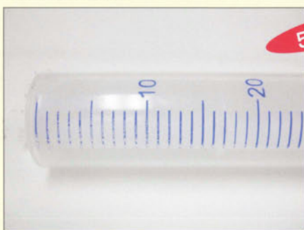
OH4830-LT(オールドプリント)