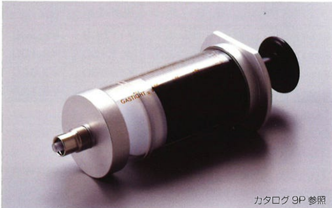
カタログ 9P 参照